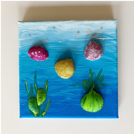
11. Die Muscheln mit Heißkleber befestigen.